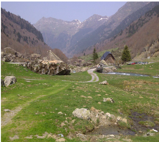
Un séjour en bordure du Parc national des Pyrénées