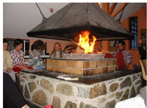
La « fameuse » cheminée de Pont de Camps