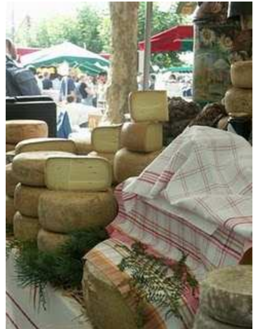
La foire au fromage de Laruns Tous les ans lors du 1er week-end d 'octobre